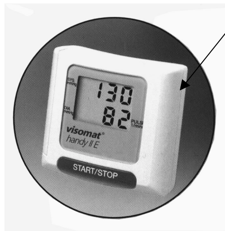
Slika 2: Izgled tlakomjera tip VISOMAT handy II E s prikazom mjesta za smještaj ovjerne naljepnice